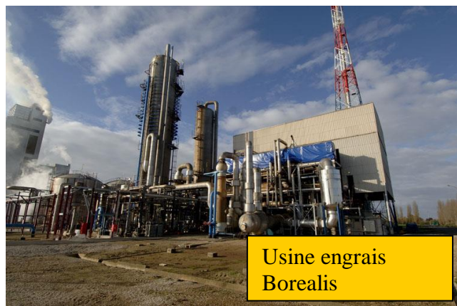
Usine engrais Borealis