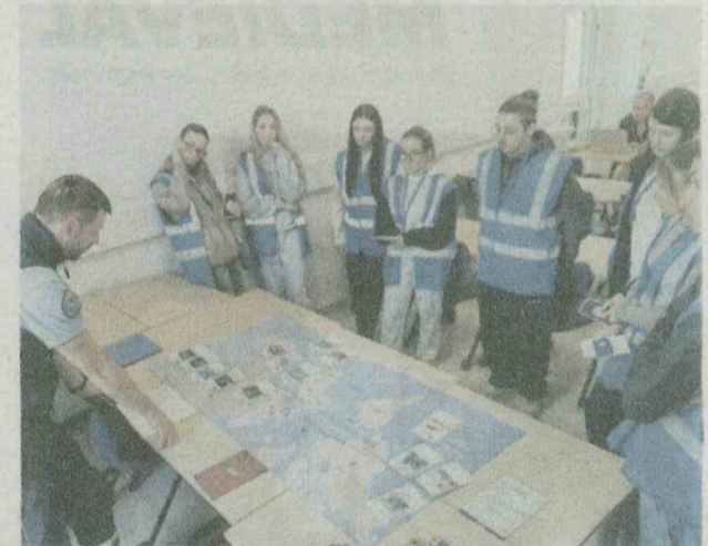
Autre moment marquant de la journée, le jeu de stratégie, réalisé autour d'un planisphère.