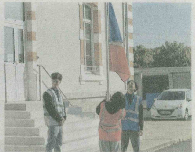
La journée démarre par le lever des couleurs, le premier des « temps forts » de la JDC.